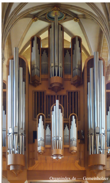
Erfurter Dom - Hauptorgel

PASSAU – VOGTLAND – WEIMAR ERFURT – REGENSBURG